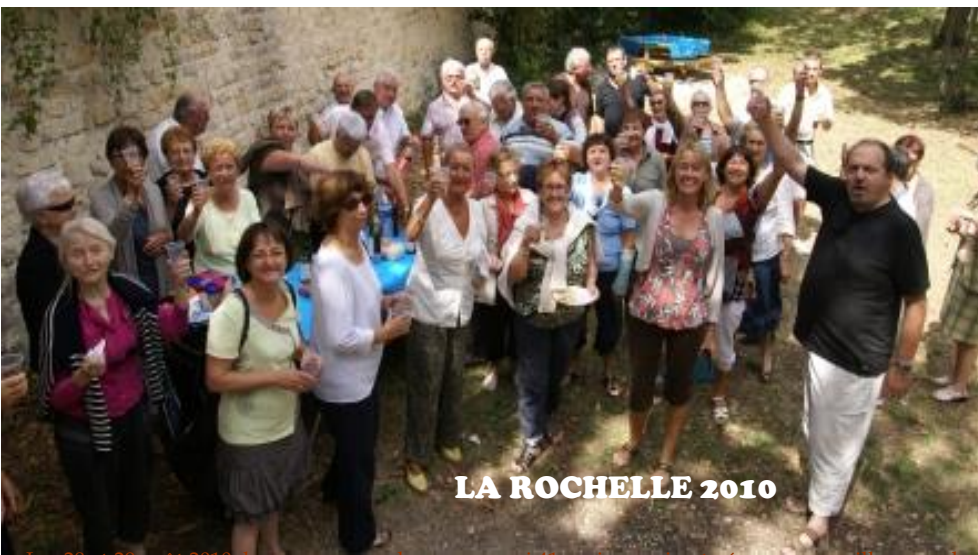
LA ROCHELLE 2010

Les 28 et 29 août 2010, le voyage annuel a encore ravi 41 anciens qui ont vécu un merveilleux week-end, parfaitement bien organisé, dans la région rochelaise, riche en visites diverses :